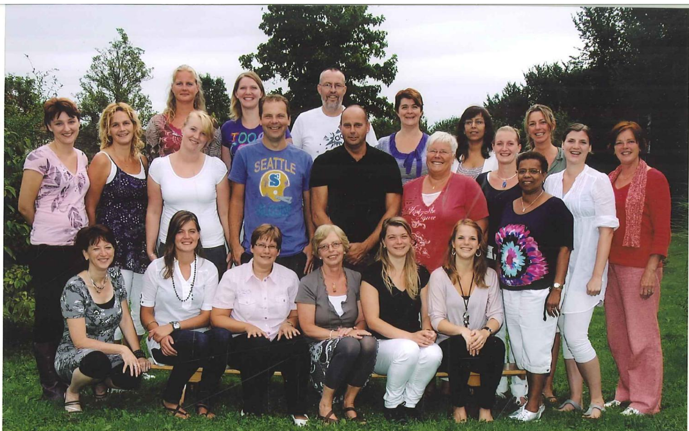
Het team van De Duiventil

Deze bijlage geeft u actuele informatie over dit schooljaar. Bij de eerste kennismaking met de school heeft u de algemene schoolgids ontvangen. Daarin staat allerlei informatie t.a.v. het beleid op school. In deze bijlage vermelden we de specifieke zaken voor dit schooljaar. Mocht u nog vragen hebben dan kunt u gerust contact opnemen met ons. We wensen iedereen een goed en plezierig schooljaar toe.